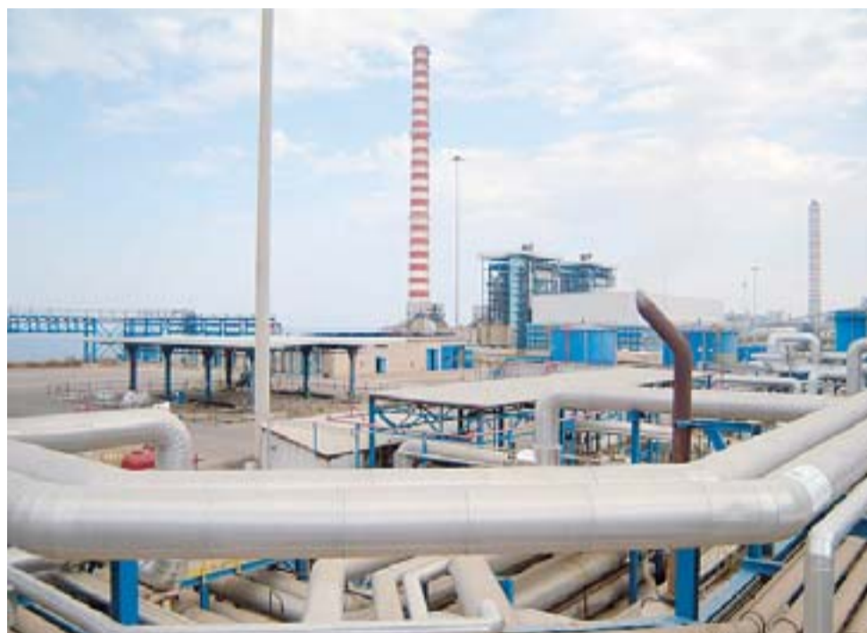
La centrale termoelettrica di Fiumesanto

GLI INVESTIMENTI. Punto secondo, la tecnologia. Le principali centrali sarde scontano i ritardi nella realizzazione di investimenti funzionali alla loro modernizzazione: si viaggia in un regime di deroga (produttive e ambientali) che produce costi sempre maggiori, che vengono interamente scaricati sul sistema-Sardegna. Enel ed E.On preferiscono tenere in vita centrali vecchie, inquinanti e obsolete, confidando sul fatto che da loro occorre sempre e comunque passare. Sarà anche per questo che E.On ha mostrato di non voler più realizzare a Fiumesanto, nel nord Sardegna, l'investimento previsto per i due nuovi gruppi a carbone al